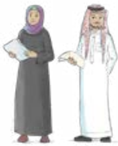
المهتمون بالتعليم بشكل عام